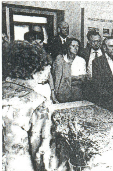
Odhafovanie pamätnej izby povstaleckej R. Viesta v Banskej Bystrici. V popredí